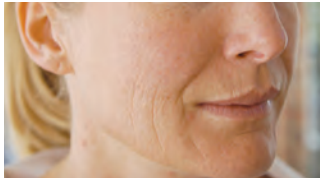
vor der behandlung