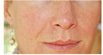
nach der zweiten behandlung