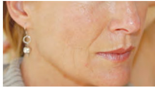
nach der zweiten behandlung

(Sämtliche in dieser Broschüre enthaltenen Lichtbilder wurden in einem kontrollierten Umfeld aufgenommen und wurden nicht retuschiert)