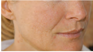
vor der behandlung

Microneedling-Behandlung mit Nimue TDS™ (Ascorbinsäure)