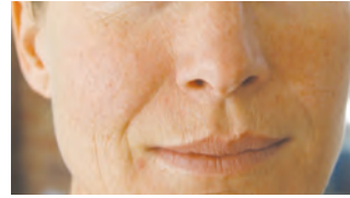
vor der behandlung

(Sämtliche in dieser Broschüre enthaltenen Lichtbilder wurden in einem kontrollierten Umfeld aufgenommen und wurden nicht retuschiert)